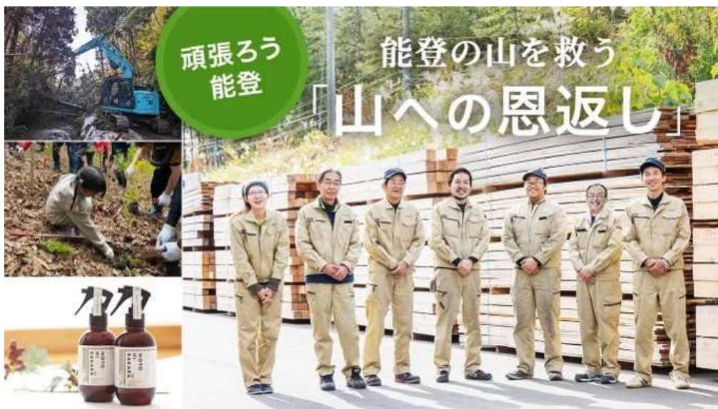
能登の山を救う「山への恩返し」